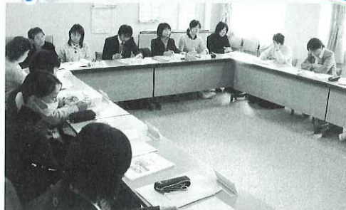
各学校から集まったふれあい編集委員(担当教諭)の皆さん

2月5日(火)、南濃総合福祉会館で福祉教育のあゆみ『ふれあい』編集委員会を行いました。福祉教育のあゆみ『ふれあい』は、福祉協力校(市内全学校)の特色ある活動内容をまとめた冊子です。編集委員会では、福祉教育担当者に参加していただき、第3号発刊に向けての進め方について意見を出し合いました。完成した第3号は来年度の社会福祉大会で配布の予定をしています。