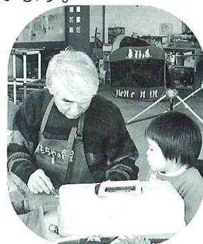
おもちゃ病院の先生