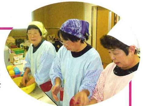
仲良しグループの皆さん