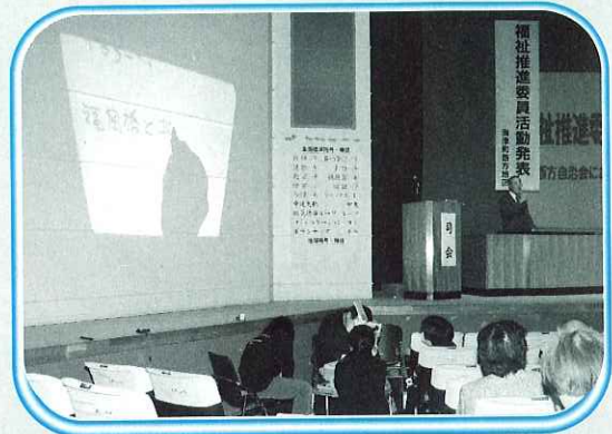
社会福祉大会で要約筆記を行うボランティアの皆さん

『はじめての要約筆記講座』の申込みは海津市社会福祉協議会まで(55-2300)お電話でご連絡ください。