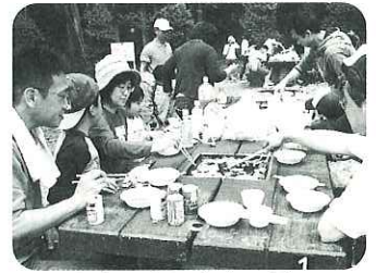
みんなで楽しくバーベキュー

毎年恒例の南濃おもちゃの図書館とろーるのバーベキューが5月5日(土)、羽根谷だんだん公園で開催されました。当日は天候にも恵まれ、約80名が参加して、わいわいおしゃべりをしておいしいお肉や野菜、かき氷を食べて楽しいひとときを過ごしました。とろーるニュースは随時HPで更新しておりますのでぜひご覧ください。