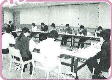
合同打合せ会議の様子

福祉協力校事業は、小・中学校及び高校の生徒を対象として、ボランティア活動や日常の身近な福祉活動を進めるなかで、福祉への理解と関心を高め、福祉の心を深める目的で行っています。4月24日に市内全学校(16校)の福祉教育担当者に集まっていただき合同打合せ会議を開きました。会議では各学校の取り組みについて意見交換を行い、事業の進め方を話し合いました。