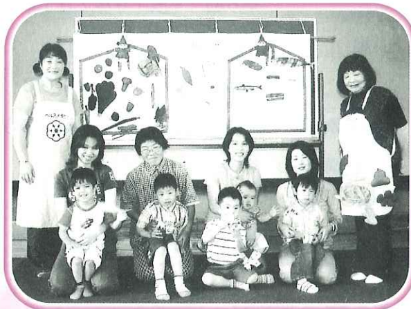
食育エプロンシアターの上演

「私達の健康は私達の手で」のスローガンのもと全国で組織されています。海津市は海津・平田・南濃の3支部において会員は210名で、市民のみなさんが健康的な食生活をしていただけるように市内各所で活動するボランティア団体です。現在、食育が叫ばれている中、正しい食生活の普及のため、保育園、幼稚園、小学校への出前講座へもお伺いしています。