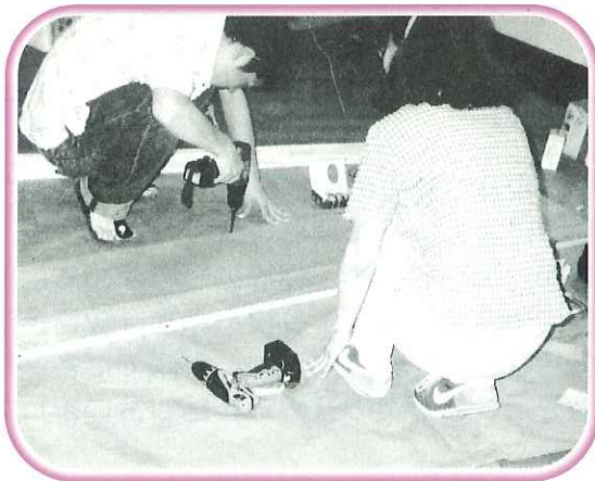
くぬぎの会 活動風景