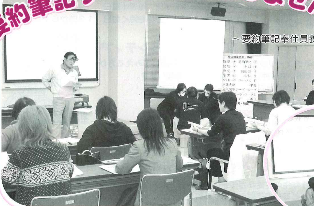
要約筆記の基本を学びました。