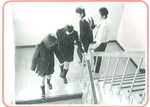
安全な誘導を心掛けます!!

心がけが大切で、相手の気持ちを落ち着かせてあげたり、寄り添ったりと、一緒にいることが一番の安心だと思いました。