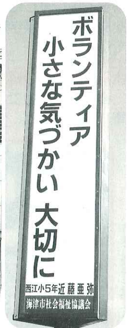
海津苑前広告塔の看板

普段の生活や地域の中で福祉意識を持ち、ふくしをより身近に感じて頂こうと、市内の小・中・高の生徒を対象に福祉標語の募集を行いました。たくさんの応募をいただいた中から各学校の優秀作品を1点ずつ選定しました。各学校の優秀作品と設置場所は下記のとおりです。応募していただいた生徒の皆さんありがとうございました。