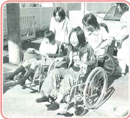
うまく段差を越えられるかな!?