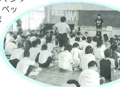
デイサービスセンターってどんなところ？

石津小学校6年生の児童がデイサービスセンター南濃へ訪問しました。訪問する前日には、デイサービスセンターで行っているレクリエーションなどを学びました。訪問当日では、児童たちが自作のマジックや紙芝居を披露したり、ペットボトルをピンにまねてボウリングをしたりと児童たちが工夫を凝らして考えたレクリエーションを利用して見える方と一緒に楽しみました。