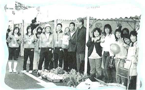
ベトナム幼稚園設立まであと一歩...

10月22日・23日の両日、海津商工祭のふれあいバザーにおいてマドレーヌや文房具などの販売を行いました。前日には一般のボランティアの皆さんに朝早くからお集まりいただき夕方までケーキ作りを、また当日は、市内外の中高生の皆さんに、販売員としてお手伝いをさせていただきました。多くの方の協力を得ることができ、目標である、幼稚園の建設に大きく近づくことができました。多くのボランティアの皆さんありがとうございました。