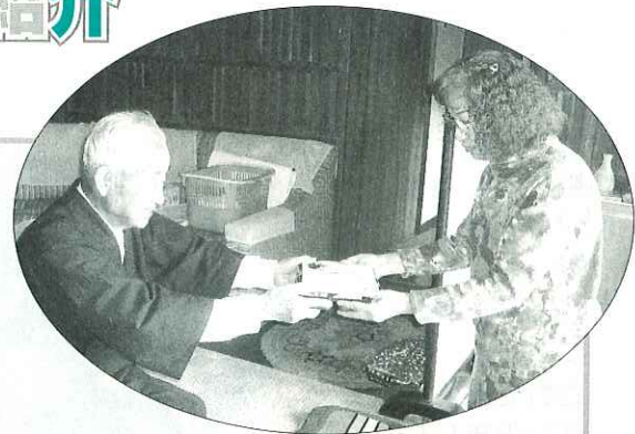
こんにちは!!お弁当ですよ!!

会 員 17名 活動日 月1回程度 活動内容 毎月、平田地区で行われる食事サービスにおいて、できたてホヤホヤのお弁当を一人暮らし高齢者の方たちに届けています。あたたかいお弁当とあたたかい挨拶に高齢者の方たちも大変喜んでおられます。