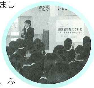
講師の話に耳をかたむける生徒達

日新中学校2年生の生徒が障害について学ぶをテーマに福祉教育実践活動を行いました。初日には、さまざまな障害の種類や障害者を支えるボランティアについて学びました。2日目は、初日に学んだことを活かし、アイマスクや車いす、手話、点字の4つの体験コースに分かれて、体験をしました。この体験を通して生徒たちは、障害の現状と課題を知ることができ、今自分たちにできることは何なのか考えました。今後もこの活動を活かして、ふくしの心が育つことを期待します。