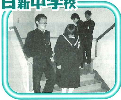
ガイドヘルプ体験の様子

日新中学校2年生の生徒が障害について学ぶをテーマに福祉教育実践活動を行いました。初日には、さまざまな障害の種類や障害者を支えるボランティアについて学びました。2日目は、初日に学んだことを活かし、アイマスクや車いす、手話、点字の4つの体験コースに分かれて、体験をしました。この体験を通して生徒たちは、障害の現状と課題を知ることができ、今自分たちにできることは何なのか考えました。今後もこの活動を活かして、ふくしの心が育つことを期待します。