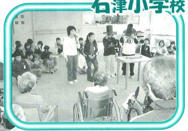
今から私達のマジックを披露します!!