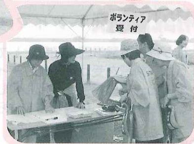
ボランティアも頑張っています。