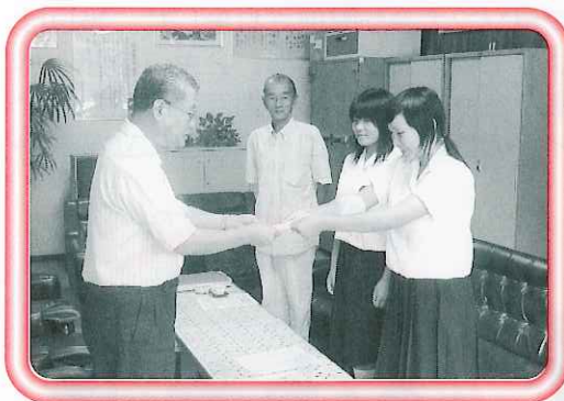
地域福祉のために・・・