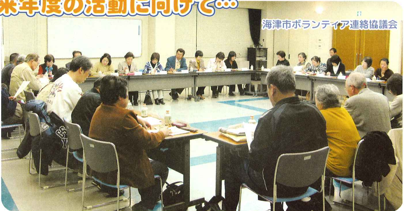
海津市ボランティア連絡協議会

海津市ボランティア連絡協議会が3月4日(火)に、海津総合福祉会館ひまわりで団体代表者連絡会議を開きました。会議では、今年度の反省と、来年度事業について話し合い、活発な意見が飛び交いました。また今年度より新たに5つの団体が新規加入され、加入団体は39団体になりました。ボランティアのネットワークがさらに深まり今後の活動の発展が期待されます。