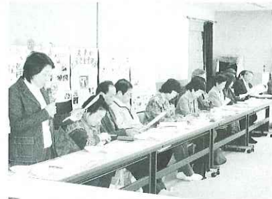
▲ 海津市の活動事例発表

今回の交流会で、相互のボランティア連絡協議会活動の幅が広がったとともに、交流も深めることができました。