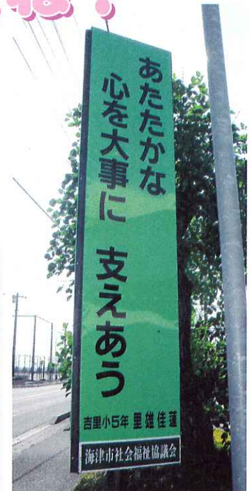
▲ひまわり前の広告塔