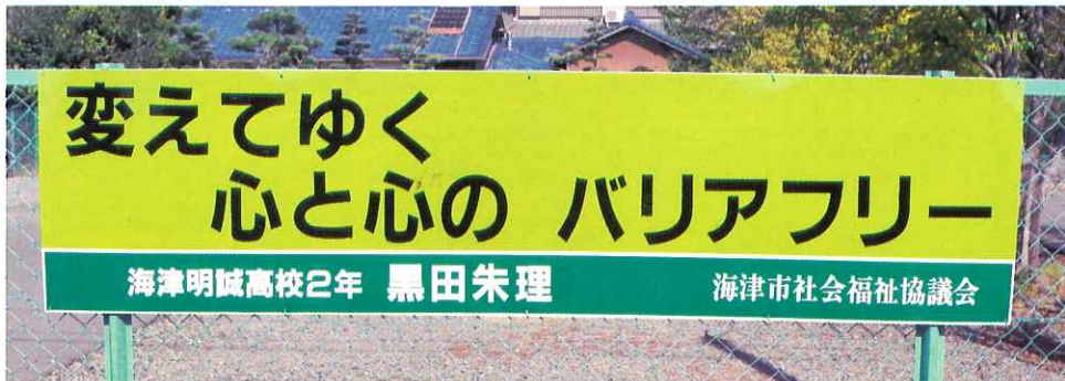
▲海津明誠高校前の看板

ふだんの生活の中で、ふくしをより身近に感じていただくことを目的に、市内の小・中・高の児童・生徒を対象に福祉標語の募集を行いました。各学校からたくさんの応募をいただき、選考委員会において、それぞれの学校の優秀作品を1点ずつ選定しました。各学校の優秀作品と看板設置箇所は下記のとおりです。応募していただきました皆さんありがとうございました。