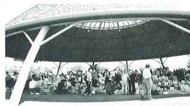
◀こん平田市ルネッサンス 開催の様子