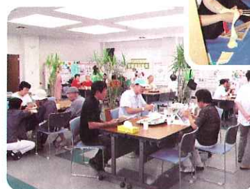
▲ 交流サロンの様子