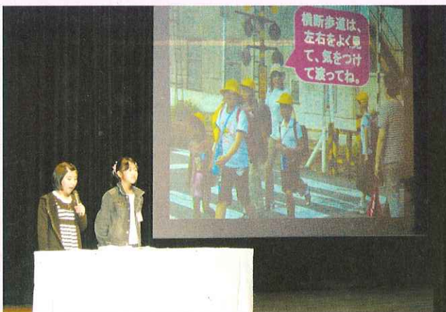
▲児童・生徒による活動発表

大会式典後には福祉協力校活動発表が行われました。市内の小学校と中学校のなかから、石津小学校と日新中学校に活動発表をしていただきました。両校とも地域の特性を活かした福祉