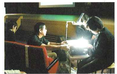
▲要約筆記サークルの皆さん

12月6日(土)、海津市文化センターにおいて第4回海津市社会福祉大会を開催しました。