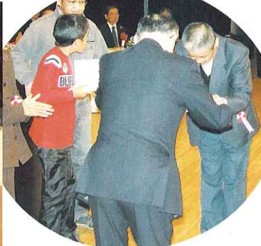
▲手話サークルの表彰の様子