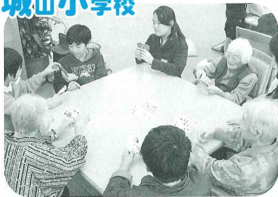
▲みんなで楽しくトランプゲーム