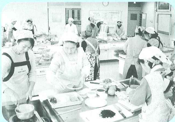
▲みんなで協力して仕上げました。

11月19日(水)、海津総合福祉会館ひまわりにおいて食事サービス部会が開催されました。