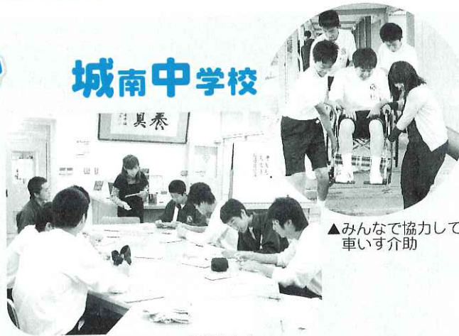
▲みんなで協力して車いす介助