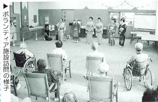
▶ボランティア施設訪問の様子

サークル活動や個人の活動を高齢者施設やふれあいいきいきサロンで披露してみませんか？ あなたの趣味や特技で皆さんを笑顔にしましょう。