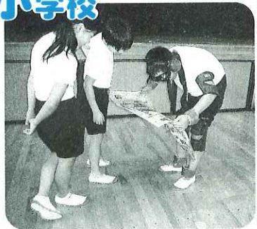
▲高齢者の気持ちを理解しました。