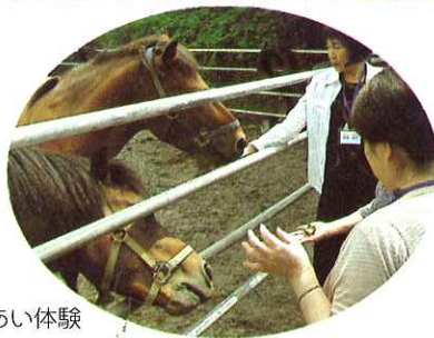
木曾馬ふれあい体験