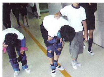
▲腰を曲げ、ゆっくりと歩く海西小の児童