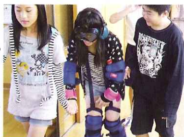
▲手を握り優しく介助する石津小の児童

10月12日(水)、10月20日(木)に石津小6年生の児童が、10月21日(金)に海西小6年生の児童が高齢者疑似体験学習を行いました。疑似体験セットを装着し、日常生活動作を体験した児童たちは、高齢者の気持ちや身体の変化を知り、相手の立場にたった介助の仕方を学びました。児童から「高齢者のかたが困っていたら荷物をもってあげるなど手助けをしてあげたいです。」と感想があり、今回の体験で学んだことを活かしてもらいたいと思いました。