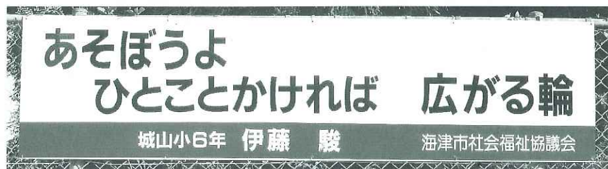
▲城山小学校内の看板

各学校からたくさんの応募をいただき、選考委員会において、それぞれの学校の優秀作品を1点ずつ選定しました。各学校の優秀作品と看板設置箇所は下記のとおりです。応募していただきました生徒の皆さんありがとうございました。