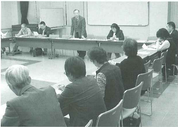
ボランティア団体の皆さん