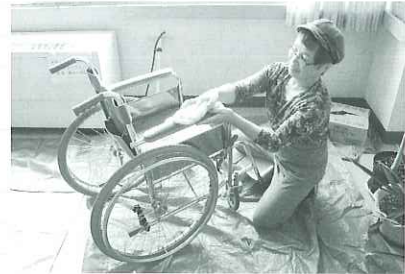
真心こめて点検します

くるま座の活動に興味があり、一緒に活動していただける方を募集しています。専門的な知識は必要ありません。一度ボランティアセンター(55-2300)までお問い合わせください。