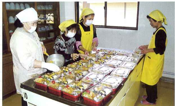
▲調理に励む、ゆう・優の皆さん

利用者の方に美味しいお弁当を召し上がっていただくため、前日から準備しています。これからも利用者の方に喜んでいただけるよう真心込めて作っていきます。