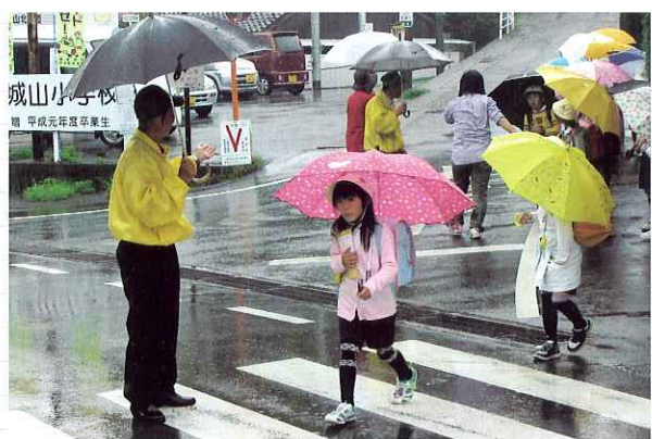
▲児童の下校を見守るボランティアさん