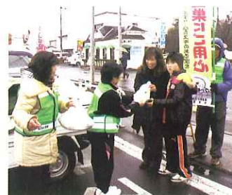
▲ 今尾の左義長で防犯のチラシ配布