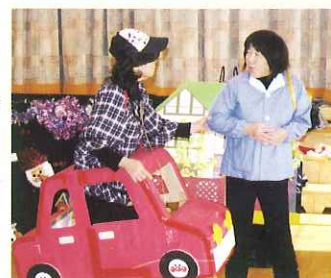
▲ すべて手作りのユーモアたっぷりの劇