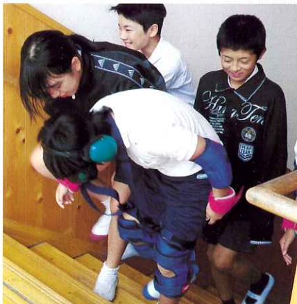
▲動きにくさを体験