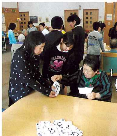
▲手作りトランプで一緒に遊んだよ