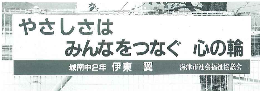
▲城南中学校前の看板

各学校からたくさんの応募をいただき、選考委員会においてそれぞれの学校の優秀作品を1点ずつ選考しました。各学校の優秀作品と看板設置場所は下記のとおりです。応募していただきました皆さんありがとうございました。