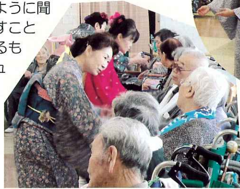
◀手と手をあわせて