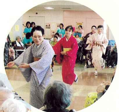
▲炭坑節を踊りました

田代会の活動と一緒に参加してみたいと思われる方は、ボランティアセンター（☎55-2300）までお問い合わせください。