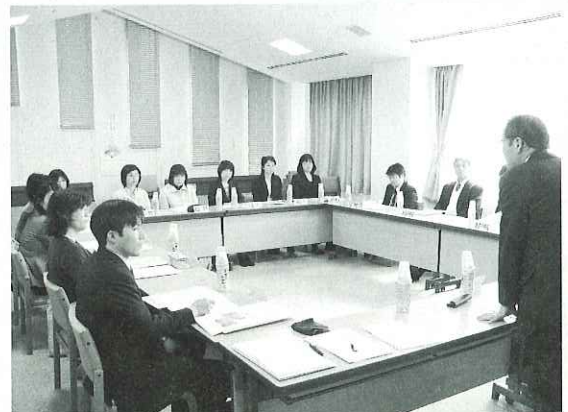
▲ 合同打ち合わせ会議の様子

また、福祉教育の進め方についても先生方がお互いに質問し合い、福祉協力校事業の活動の幅を広げるとともに、学校間の交流も図ることができました。