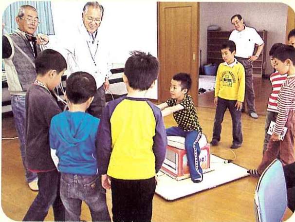
▶児童たちと一緒に科学教室

みのサイエンスボランティア会の活動に関心があり、一緒に参加してみたいと思われる方はぜひ下記までお問い合わせください。