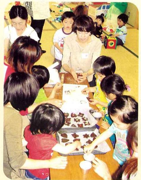
◀おいしいクッキーできるかな!?