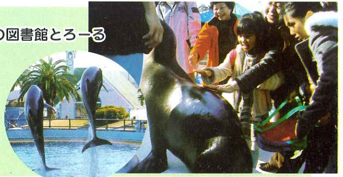
▲イルカショーに感激

12月13日(土)、南濃おもちゃの図書館とろーるが南知多ビーチランドに遠足に出かけました。当日は天候にも恵まれ43名の親子の参加があり、イルカやアシカのショーを鑑賞し、楽しいひとときを過ごしました。また子どもたちはペンギンやアシカとふれあうこともでき、貴重な体験となりました。