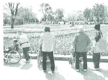
▲車いす介助ボランティア活動の様子