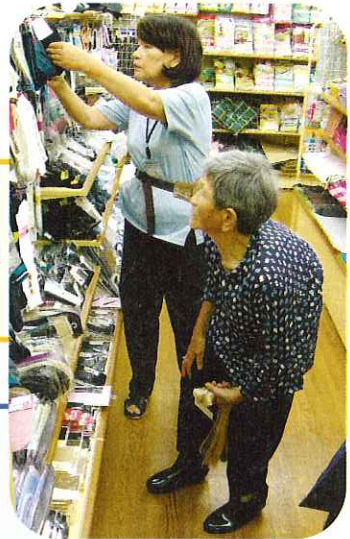
▶デイサービスの利用者につき添って買い物のお手伝い

活動内容 特別養護老人ホーム松風苑でのシーツ交換や、福祉施設の利用者が外出される際の車いす介助などのお手伝いをしています。