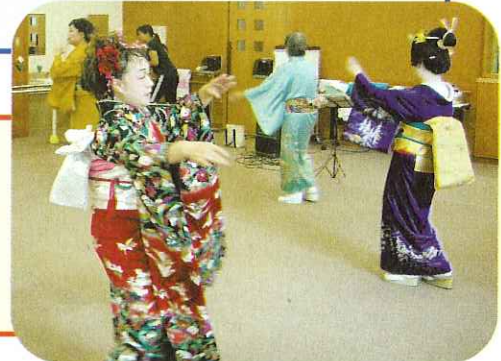
▶特技を活かしてボランティア

活動内容 市内のデイサービスセンターなどの老人福祉施設を訪問して、昔懐かしい歌や踊りを披露します。利用者の方からも大好評です。