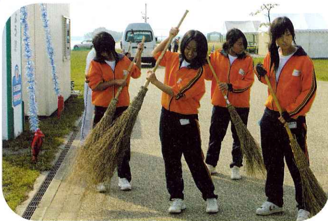
▲選手のために清掃する日新中の生徒たち