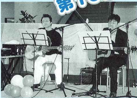
▲昨年のコンサートの様子