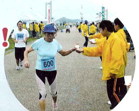
▲選手に給水するボランティア

10月5日(日)、長良川サービスセンター前河川敷の木曾三川公園特設会場において、第13回長良川ふれあいマラソン大会が開催されました。大会には、ハンディのある人もない人もあわせて約530名が選手として参加しました。当日はあいにくの雨模様でしたが、選手たちは元気に走り抜けました。