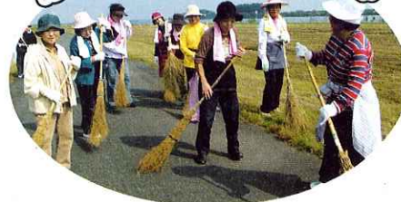
▲一生懸命コースの清掃をしました

大会前日の10月4日(土)にマラソンコースの清掃を行いました。清掃には、日新中学校の生徒、海津明誠高校の生徒、一般ボランティアの皆さん約150名が参加されました。選手たちが気持ちよく完走できるようにと願い、コース上の小石やゴミなどを竹ぼうきで掃きました。本大会はボランティアの力が大きな支えとなり、海津で13回を数えることができました。来年もご協力よろしくお願いいたします。