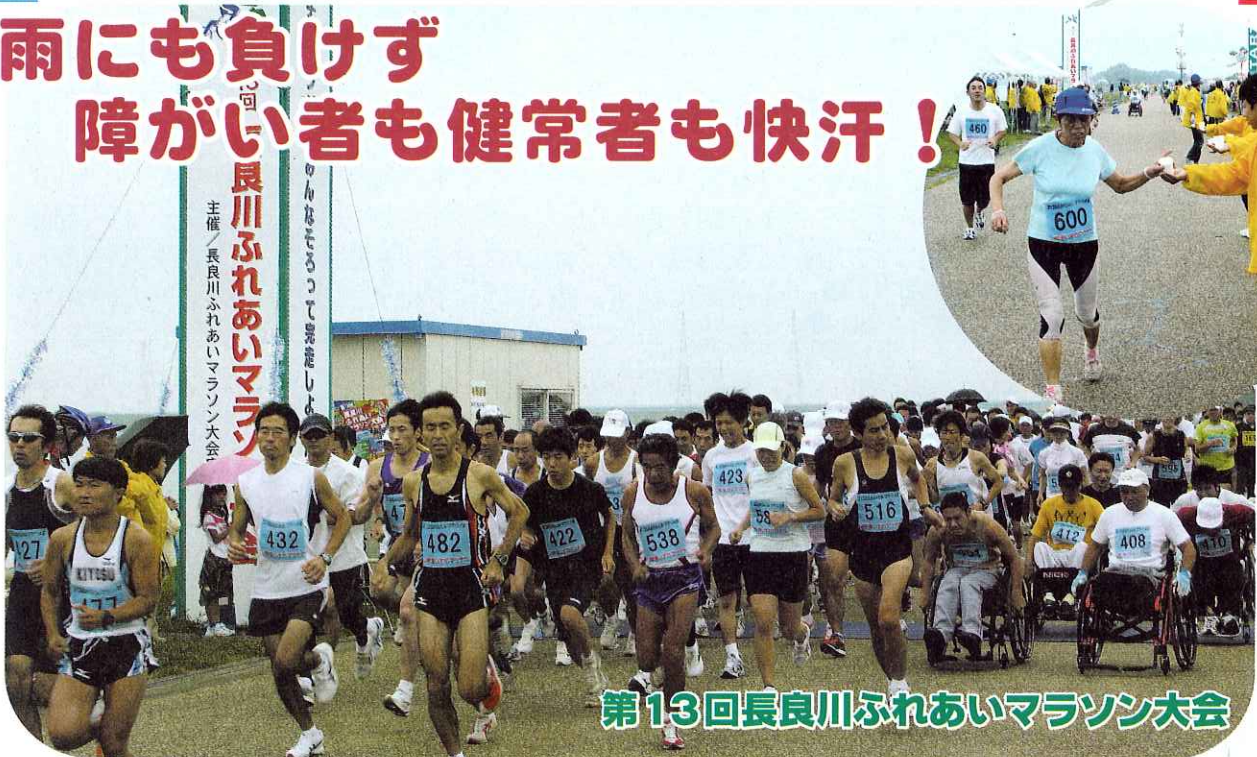
第13回長良川ふれあいマラソン大会