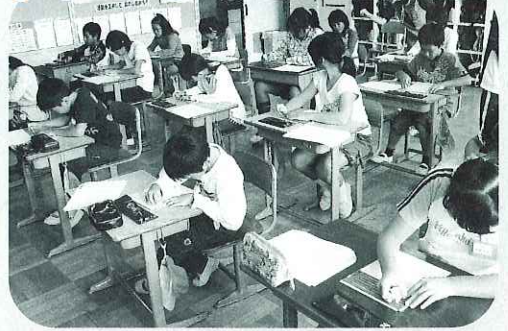
▲点字のしくみを学びました