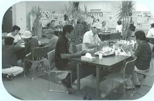
▶ボランティア交流広場

海津市ボランティア連絡協議会主催『第3回わくわくボラDAY』が8月3日(日)、海津総合福祉会館で開催されました。今回のわくわくボラDAYでは、例年のボランティア団体の活動紹介コーナー、体験・実演コーナーの他に市内各学校の福祉活動の紹介コーナーも設けられ、多くの方々に賑わいました。また、前日の準備には、海津明誠高校の生徒の皆さんに会場設営のご協力をいただきました。