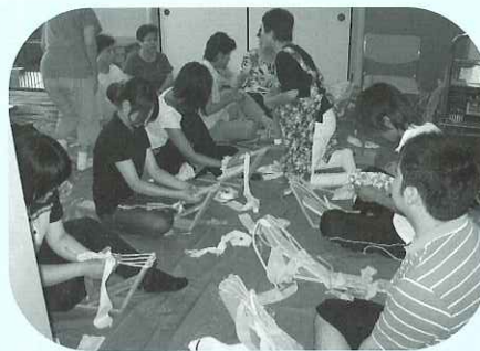
▶民協による布草履づくりコーナー

海津市食生活改善協議会 エプロンシアター 紙芝居 海津地区民生委員児童委員協議会 布草履づくり