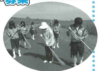
▲大会前日のコース清掃