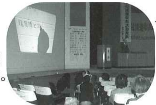
▶社会福祉大会での要約筆記

要約筆記とは、聴覚障がい者に話の内容をその場で文字にして伝える筆記通訳のことです。現在サークルでは、一緒に活動していただける方を募集しています。興味がある方や要約筆記をはじめたい方は一度見学に来てください。