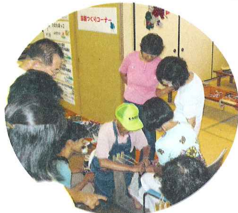
第2回わくわくボラDAYの体験コーナーの様子