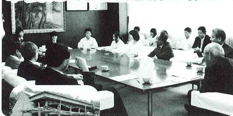
▲アジア障害者の会に協力した生徒たち