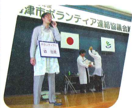
ボランティア活動保険をテーマにした寸劇

5月30日(金)海津市ボランティア連絡協議会の平成20年度総会が、海津市文化センターで行われました。総会では今年度の事業計画や予算が承認され、わくわくボラDAYを実施することに決定しました。