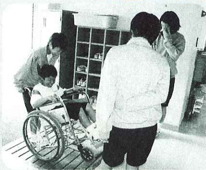
▲車いすの操作を学びました