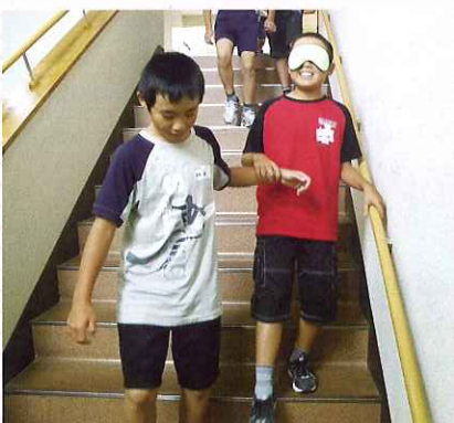
▶ 階段はゆっくり安全に