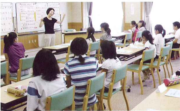
▶ 手話コースの様子

夏休み期間を利用して、市内に通う小学生、中学生、高校生を対象としたボランティアスクールを開催しました。ボランティアスクールは、ボランティア体験学習を通して共に学び合い、ふくしに興味や関心を持ってもらうことを目的としています。