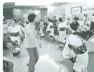
▲みんなで踊ると楽しいね