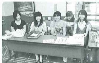
▲手伝ってくれた学生ボランティアさんたち

この度、わくわくボラDAYにて東日本大震災支援バザーと募金活動を行ったところ、多くの御厚志を賜りました。厚く御礼を申し上げます。皆様方から頂戴いたしました全額5万円は、災害義援金として共同募金会へ寄付をさせていただきました。今後とも御協力よろしくお願ひいたします。