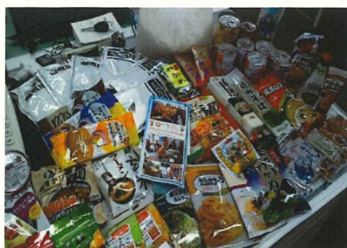
ご寄付いただいた食品