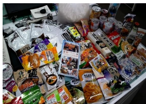
ご寄付いただいた食品

穀 類： 米 乾麺 パスタ 小麦粉 保存食品： 缶詰 瓶詰 乾 物： のり 昆布 鰹節 豆類 調 味 料： 塩 砂糖 しょうゆ ソース インスタント食品： ラーメン 焼きそば 他 レトルト食品： カレー パスタソース 他