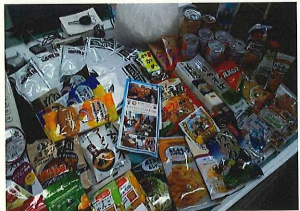
写真ご寄付いただいた食品